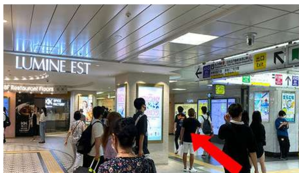
③「ルミネエスト」の地下入口があります。