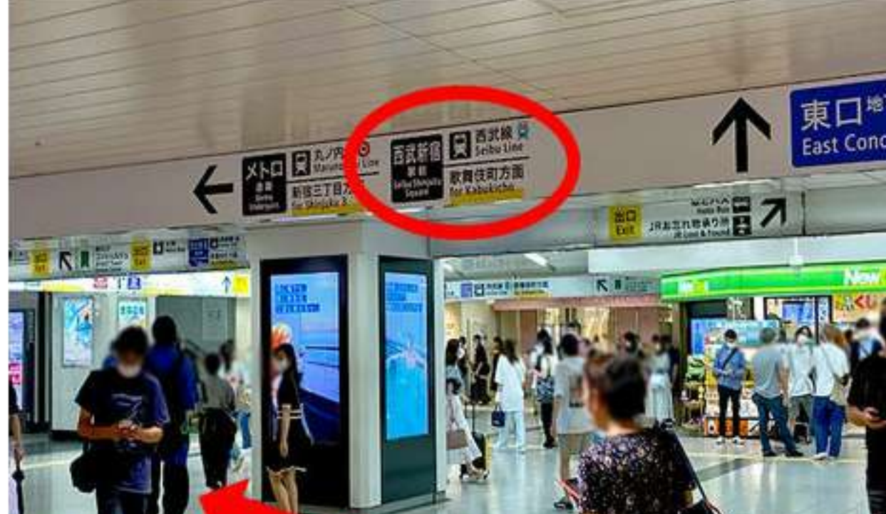
②突き当たりに「NewDays」が見える少し手前で、左方向に西武新宿駅の案内表示が出ています。指示に従って左に進みます。