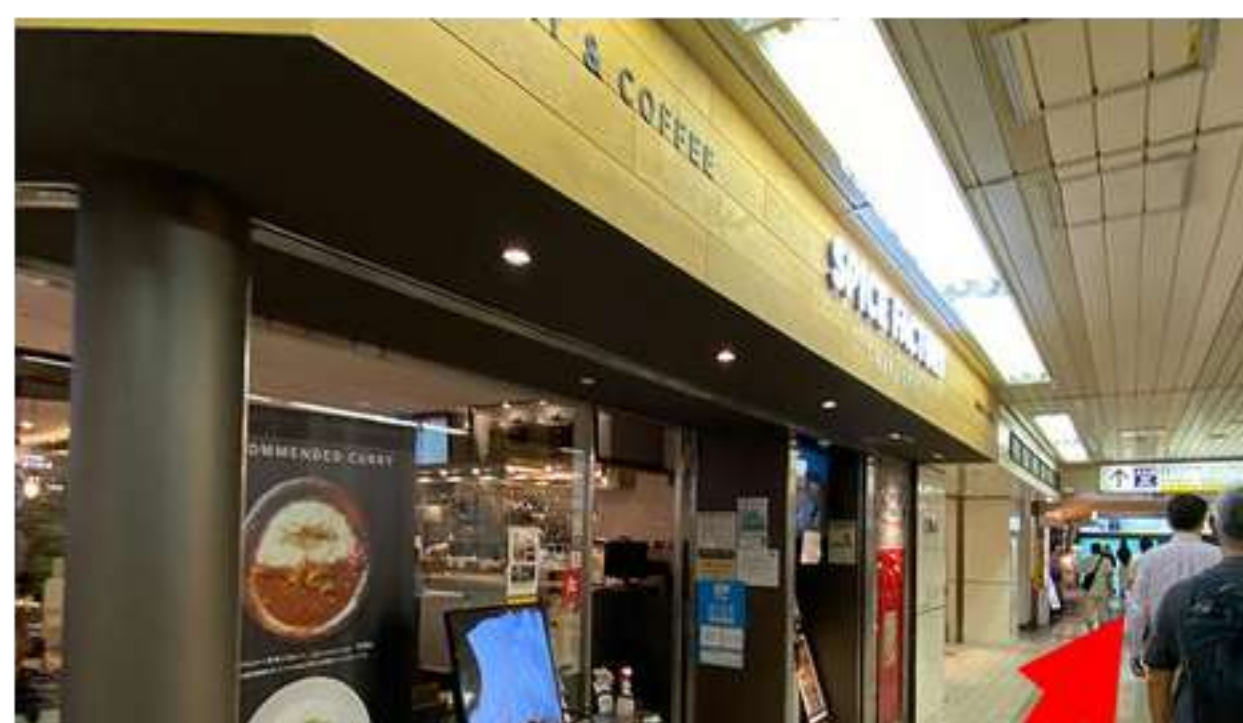
④カレー屋さんの右脇の道をしばらく直進します。