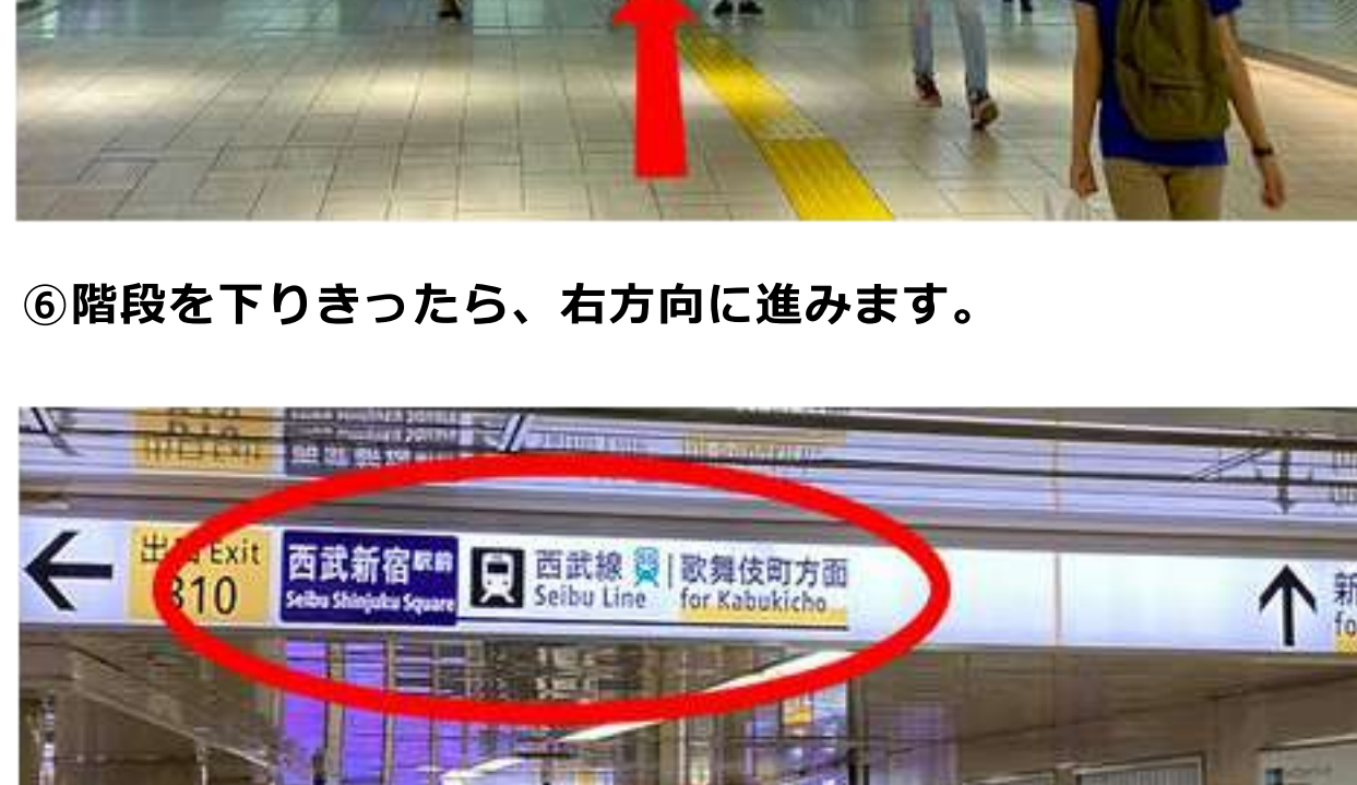
⑧丸ノ内線の改札を越えてしばらく進むと、西武新宿駅に左矢印の案内表示が出ています。指示に従って左に曲がります。