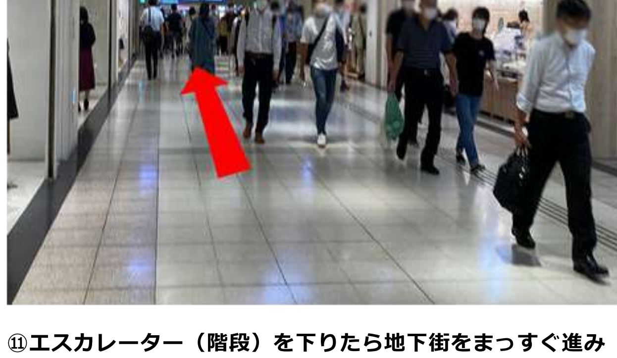
⑬直進の案内表示が出ているのでまっすぐ進みます。