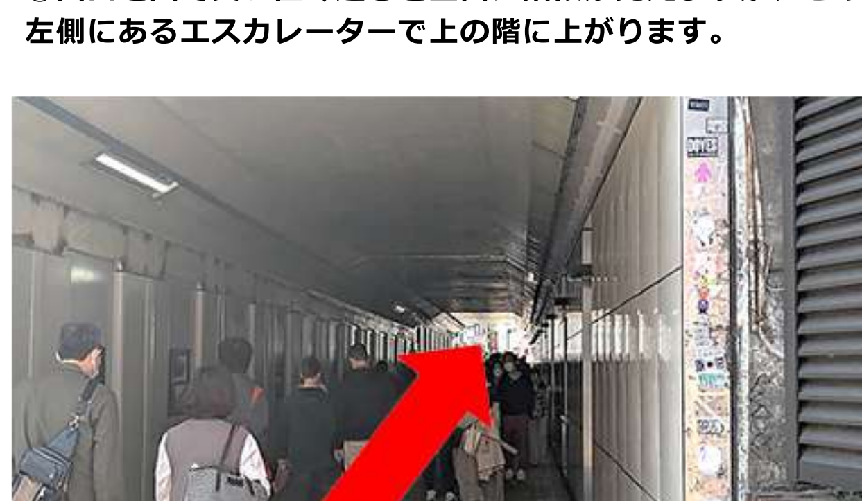
⑳ここから入ります。