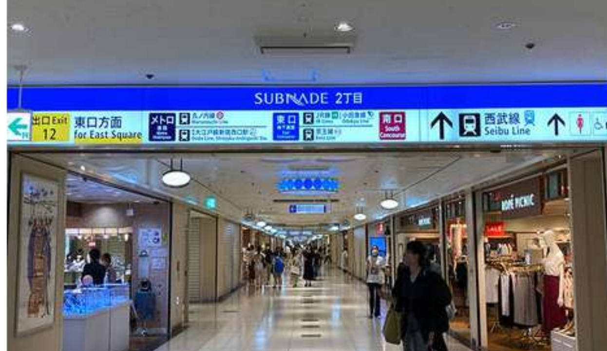
⑮しばらく進むと西武新宿駅方面の地下街出口があるので、これを出ます。