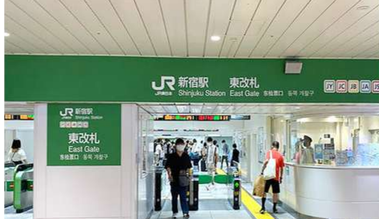
①起点はJR新宿駅の「東改札」です。ここから東方(改札を出て右方向)に進みます。