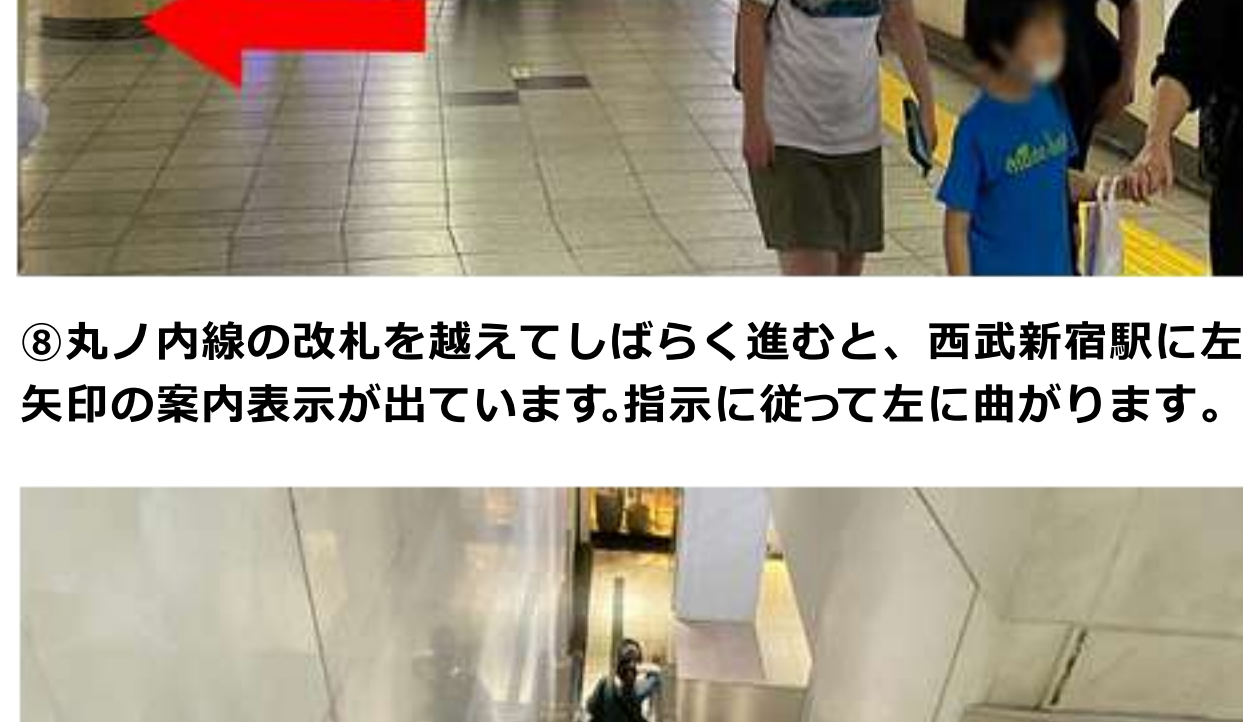
⑩エスカレーター(階段でも可)があるので下りていきます。