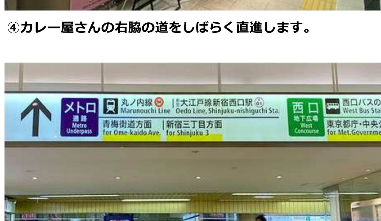
⑥階段を下りきったら、右方向に進みます。