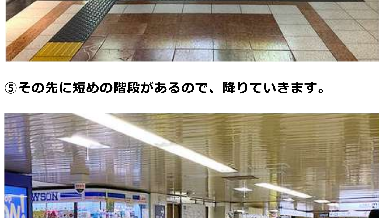
⑦右に進むと小さな「ローソン」があり、その先に丸ノ内線の改札が見えてきますが、ひたすら真っすぐ進みます。